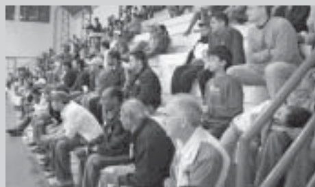
A arquibancada estava lotada. A torcida era grande dos dois times

dente de uma final, a disputa foi profissional e sagrou a Pizzaria Firenze/Santana A. C. vencedora do campeonato.