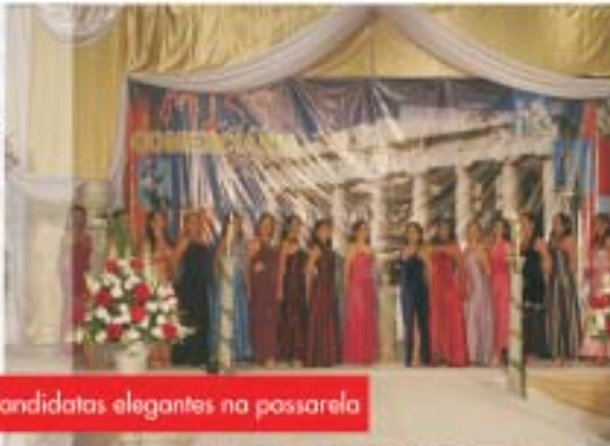
Candidatas elegantes na passarela

Dezoito lindas e ansiosas candidatas, e uma mesa composta por onze jurados com uma difícil missão: eleger a mais bela comerciária de 2007. Afinal, a beleza e o luxo desfilaram na passarela o tempo todo, desde a primeira entrada das candidatas, vestidas de Deusas, na cor vermelho, complementando o cenário e o tema da festa, "Grécia Antiga" com total maestria.