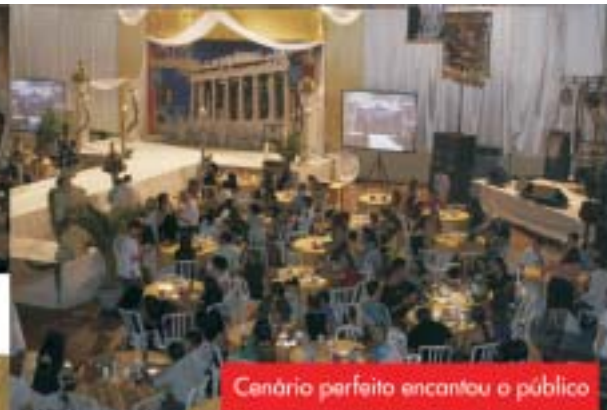
Cenário perfeito encantou o público