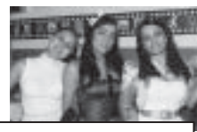
Muito laço e bolinha na festa