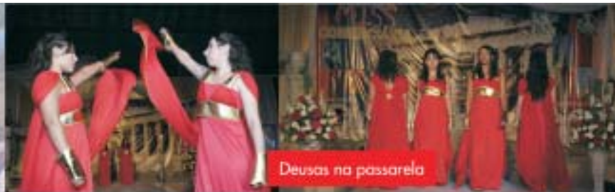
Deusas na passarela