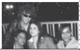
Descontração entre amigos