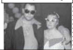
Casal no ritmo dos anos 60