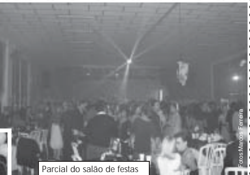
Parcial do salão de festas