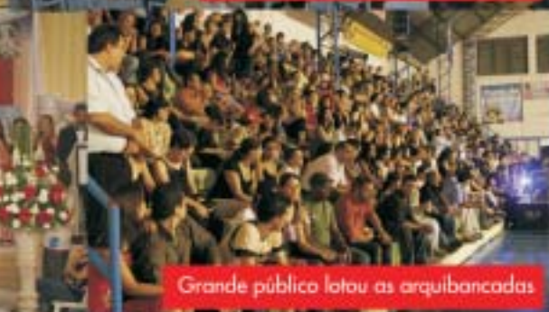
Grande público lotou as arquibancadas