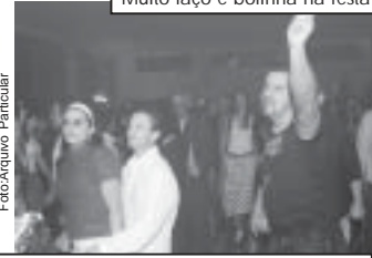
Animação total na pista de danças