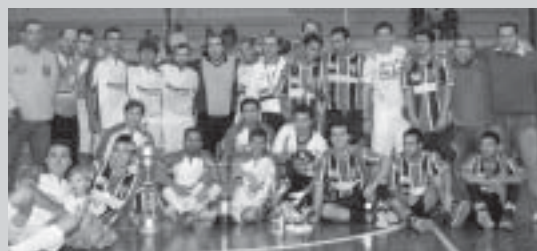
Equipe campeã e a vice durante encerramento

Durante o jogo, apesar do nervosismo evi-