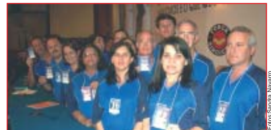
Comitiva do nosso sindicato, formada por diretores e funcionários durante o encerramento do Congresso