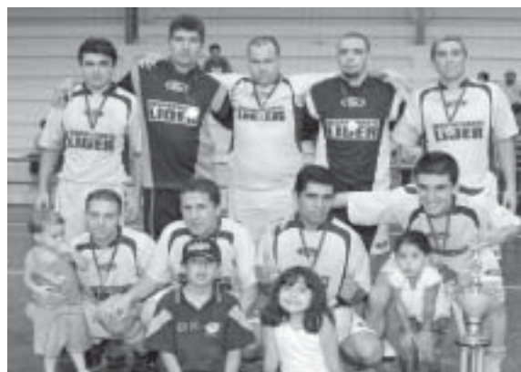
Líder, a equipe campeã do 32º campeonato futsal

A animação da torcida era percebida a cada lance, e a AMERICAN SPORTS mais uma vez saiu na frente marcando seu