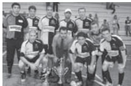
Atletas da American Sports, a vice-campeã deste ano

gundo tempo, o nervosismo das duas equipes era evidente, mas uma grande surpresa estava por vir.