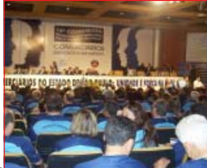
Parcial do congresso dos comerciários em Praia Grande

Mais 750 participantes, palestras e palestrantes de peso, além de uma estrondosa organização foi demonstrada pela Federação dos Empregados no Comércio do Estado de São Paulo (FECESP) dentro da Colônia de Férlas, em Praia Grande, durante o 16°. Congresso Sindical Comerciário, que este ano trouxe o tema COMERCÍARIOS QUEM SOMOS E O QUE QUEREMOS.